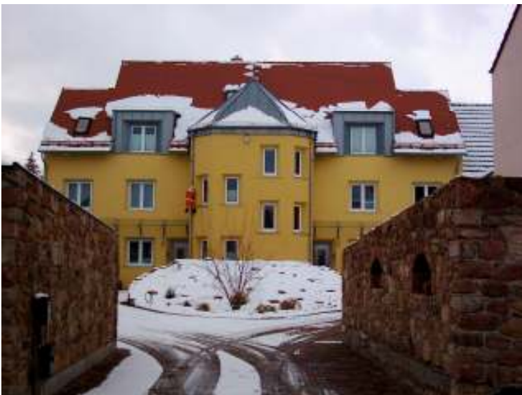
67459 Böhl-Iggelheim PASSIV-VILLA HALLERDACH® PASSIV

Besonderheit: Dach und Achteck-Turm in U-Wert 0,06 W/m 2 K