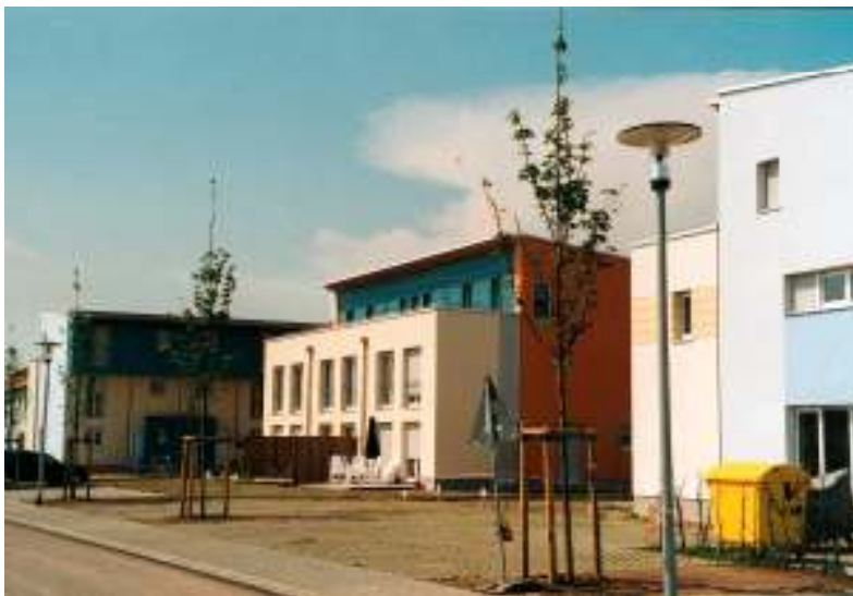
65428 Rüsselsheim 80 RH PASSIV- Wohnanlage HALLERDACH® KOMBI „C“

Besonderheit Wohnanlage in verschiedenen Haustypen.