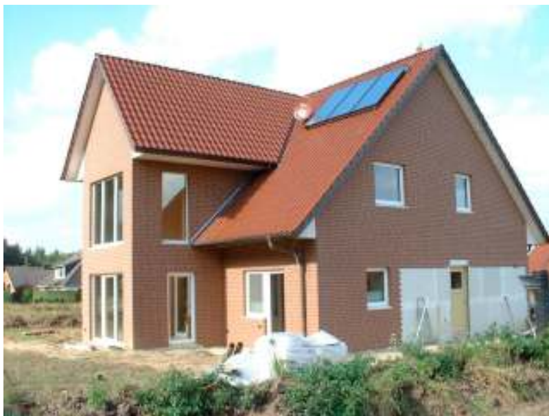
27624 Drangstedt PASSIV-HAUS, HALLERDACH® PASSIV