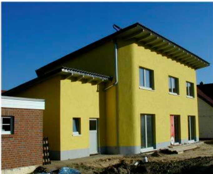
31319 Sehnde PASSIV-Haus HALLERDACH® PASSIV